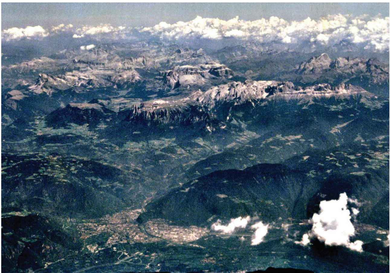
Luftbild Bozen "Im Talkessel", Luftaufnahme, 2019

Baukultur zwischen Berg, Beton und Bozen